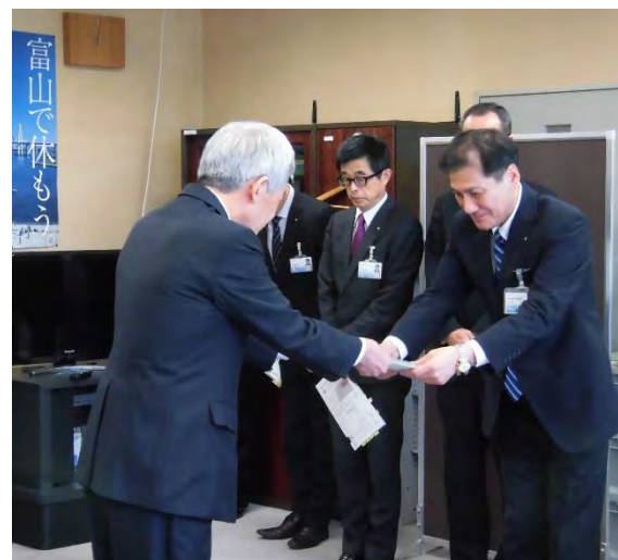
【教材本贈呈式の様子】